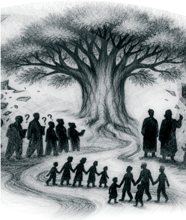
Sergio Ricciuto Conte

TEMA: Resistência contra a centralização imperialista.