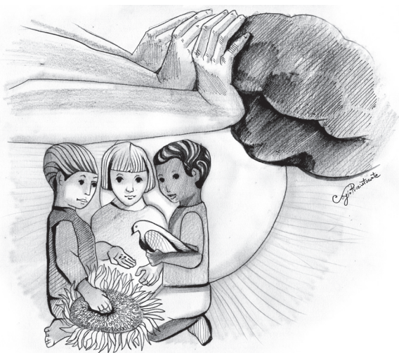
SERGIO RICCIUTO CONTE