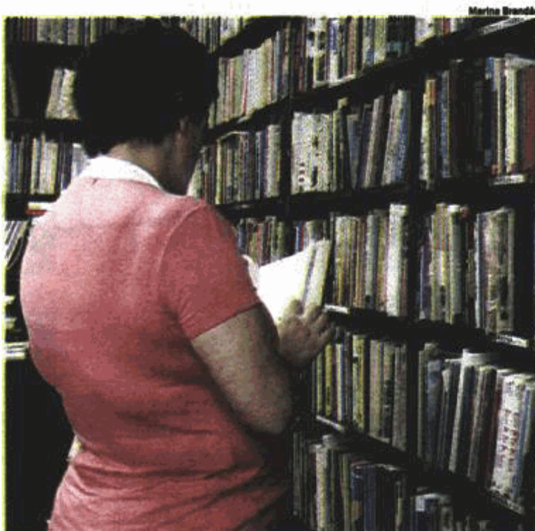
Bibliotecas municipais do Grande ABC têm livros exigidos em vestibulares

Mesmo os títulos que passaram a ser obrigatórios este ano na prova da Fuvest (Fundação Universitária para o Vestibular) podem ser adquiridos por preços bem em conta. Viagens na Minha Terra , de Almeida Garrett, por exemplo, pode chegar a custar R$ 35, mas é